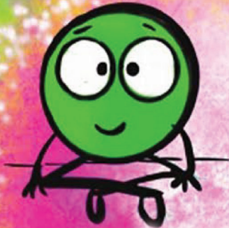
نقطه ی آرامش