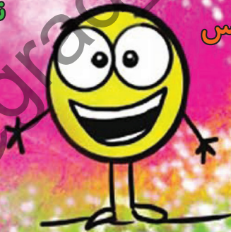
نقطه ی خوشبختی