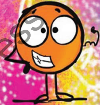
نقطه ی اعتماد به نفس